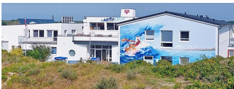
Willkommen an Bord der MS Waterdelle Die CVJM-Jugendherberge in den Dünen Borkums

4 x im Jahr Der Gemeindebrief für Dezember 2023 bis Februar 2024 erscheint am 30. November.