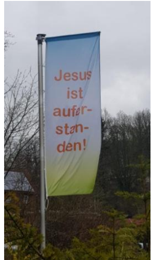
Diesjährige Osterbeflaggung vor dem Daniel-Schäfer-Haus in Almena