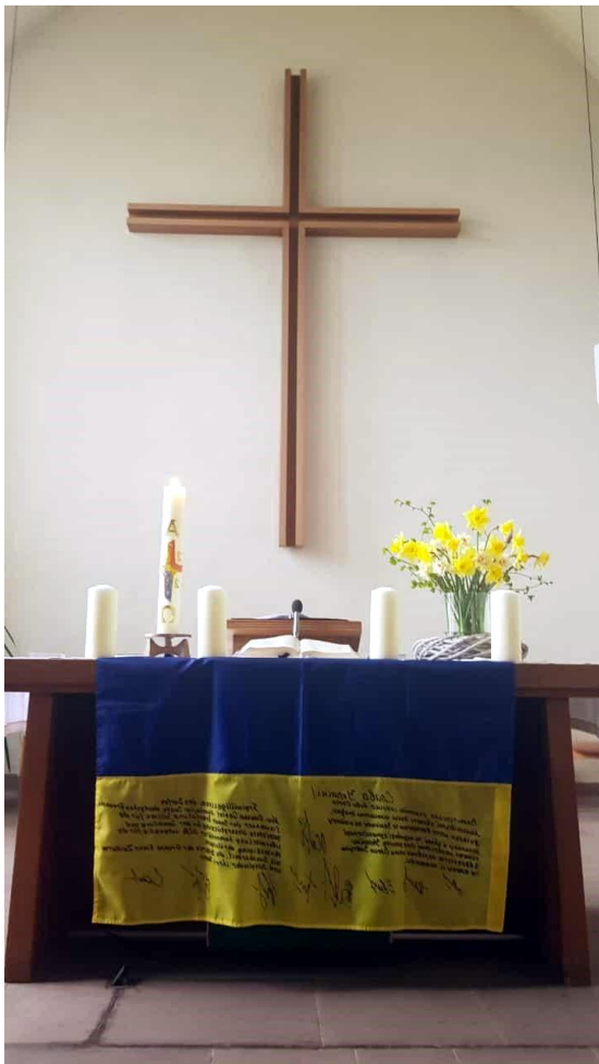
Gemeinsamer dreisprachiger Gottesdienst (deutsch, ukrainisch, russisch) zum orthodoxen Osterfest am 16. April in Silixen, mit vielen Geflüchteten aus der Ukraine