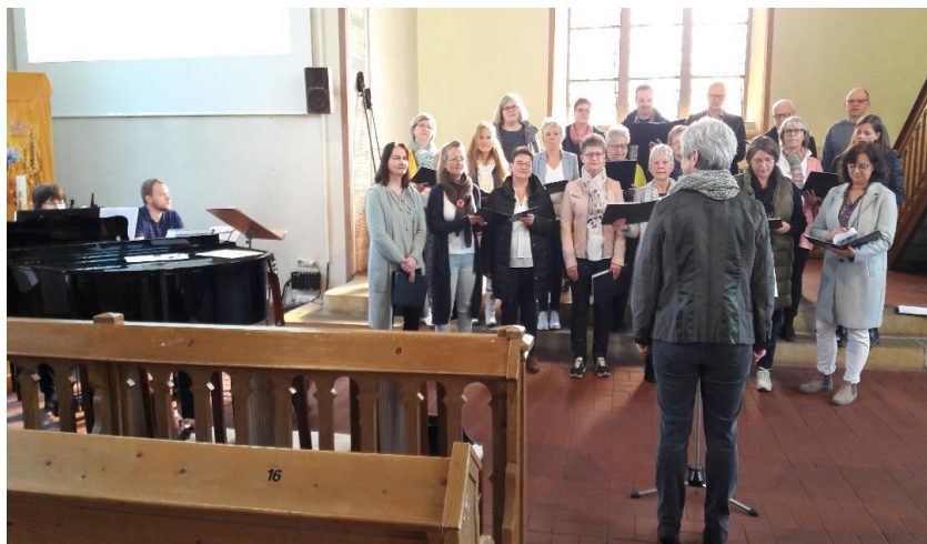
Der Chor der EC-Gemeinschaft Vlotho-Wehrendorf am 23. April zu Gast in der Almenaer Kirche