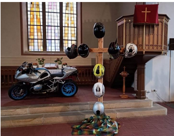
Biker-Gottesdienst am 02. April