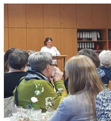
„Ladies Night“ der Kirchengemeinden Almena, Hohenhausen und Langenholzhausen am 21. April im übervollen Daniel-Schäfer-Haus