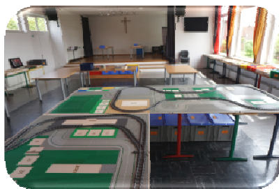
Die leeren Bau-Platten