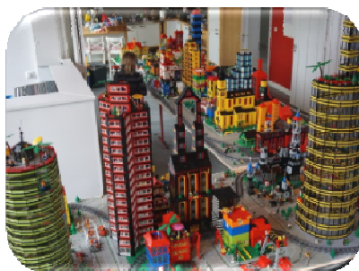
So könnte es aussehen!