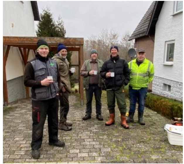
Weihnachtsbaum 2022 für die Kirche – ein hartes Stück Arbeit!