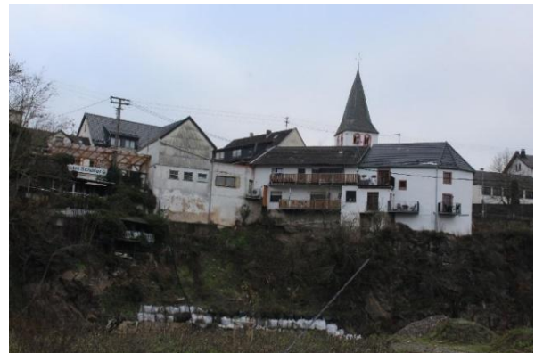
Diakonisch-humanitäre Hilfe aus dem Extertal fürs Ahrtal im Januar

Gottesdienst mit dem EC-Chor Wehrendorf am Sonntag, 23. April 2023 um 10.00 Uhr in der Almenaer Kirche.