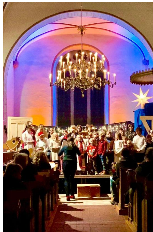
Krippenspiel „Weihnachten auf dem Dachboden“ am Heiligabend 2022 in der Almenaer Kirche