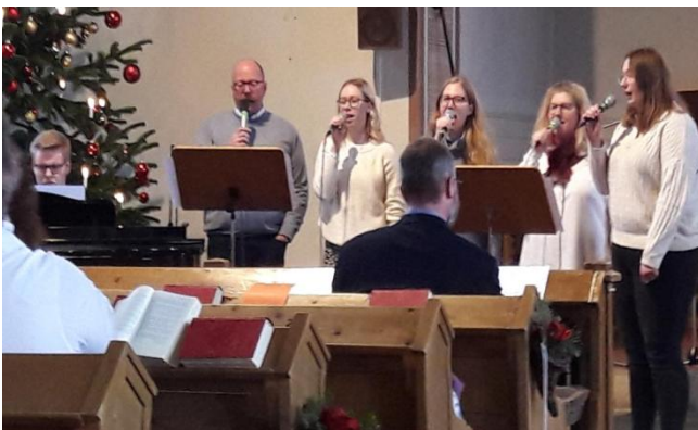
Musikteam unter dem Weihnachtsbaum