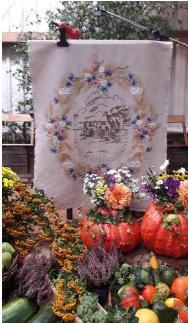
Links: Hoferntedankfest am 25. September auf dem Hof der Familie Baule in Meierberg mit dem Tuch „An Gottes Segen ist alles gelegen“