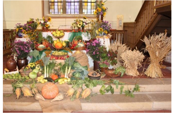
Oben: Erntedankaltar am 2. Oktober in der Almener Kirche