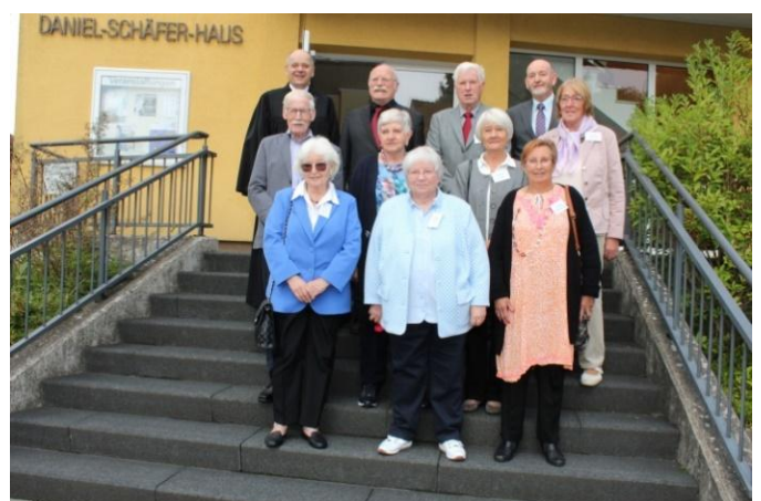
Eiserne (links) und Diamantene (rechts) Konfirmation am 11. September 2022